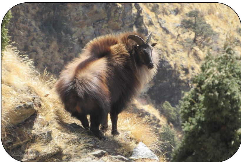
Mâle tahr, inaturalist

Le tahr de l'Himalaya a une activité diurne, il est principalement actif tôt le matin et en fin d'après-midi, avec une période de repos en journée. Les mouvements altitudinaux journaliers sont très importants, continuellement en recherche de nourriture, il arpente la montagne (jusqu'à 700m de dénivelé positif dans la journée) avant de redescendre au crépuscule. Cet ongulé est l'une des proies principales de la panthère des neiges. Les jeunes de quelques jours peuvent être menacés par des grands rapaces, des martres ou des renards.