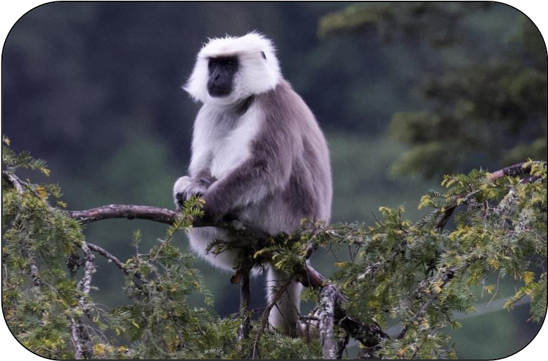
Langur gris du Népal, karocconiff

Comme l'ensemble des primates, le langur gris du Népal est très agile. Pour se protéger de ses prédateurs, cette espèce diurne passe la nuit dans les arbres (c'est une espèce arboricole). La journée, il occupe son temps entre la recherche de nourritures (activités la plus importante chez le mâle), le déplacement (une moyenne de 1.6km par jour), les activités sociales (+50% du temps chez le jeûne) et le repos. Son régime alimentaire se compose de 40 à 60 % de feuilles, 20% de fruits et le restant de racines, d'écorces, de fleurs et de petits insectes (les proportions peuvent varier selon la saison).