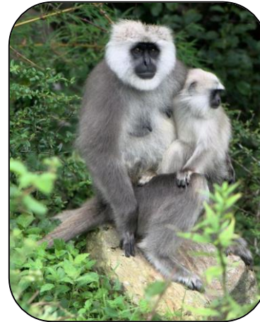
Langur gris du Népal, inaturalist

Semnopithecus schistaceus et Semnopithecus ajax sont deux espèces de langur d'altitude. Pour ne pas les confondre on peut observer la fourrure de l'abdomen. Si elle est plutôt gris-jaunâtre, alors il s'agit d'un individu S.ajax (ses avant bras sont d'ailleurs plus foncés) et si elle est complètement blanche, il s'agit de S.schistaceus . Parfois confondus, leurs aires de répartition sont assez distinctes car S.ajax est normalement, uniquement présent dans une petite portion nord-ouest de l'Inde (province du Kashmir).