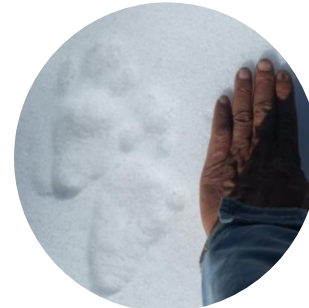
Empreinte des pattes