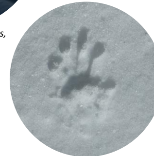
Empreinte de la main, inaturalist