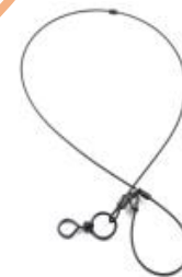
Piège à collet, ducatillon