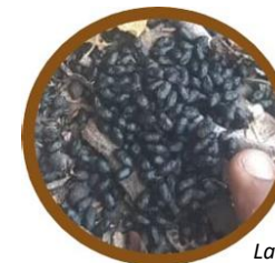
Latrine, sciences et avenir