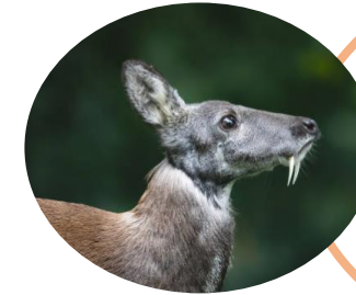
Cerf porte-musc