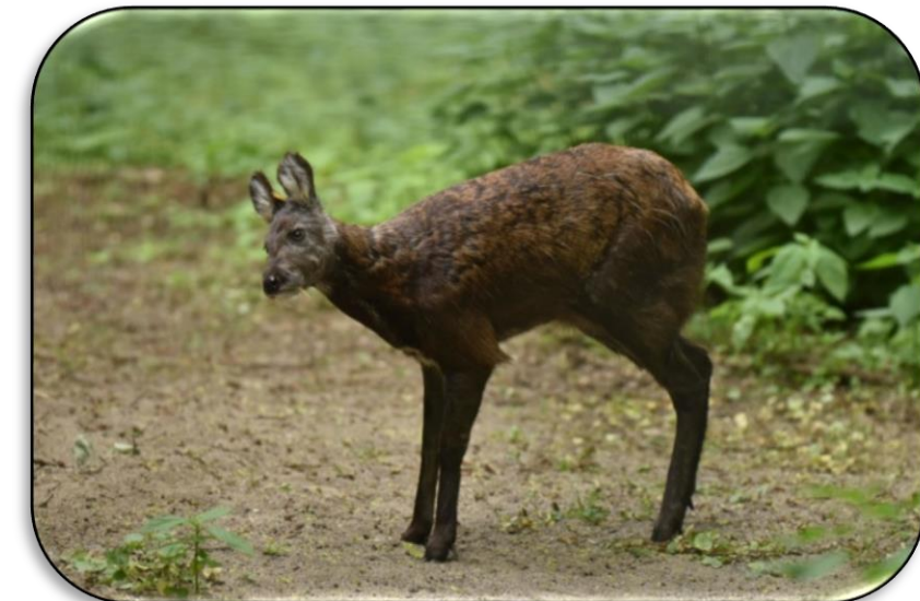
Cerf porte-musc, leszodanslemonde

Le Cerf porte-musc est solitaire (hormis lors de la période de rut) et sédentaire. La taille moyenne de son territoire est comprise entre 13 et 23 km 2 (les territoires des mâles ne se chevauchent pas). Ce dernier a une activité crépusculaire, coïncidant avec les heures de chasses de ses prédateurs (celles-ci débutant vers les 18h, pour se finir au petit matin). Le cerf porte-musc supporte très mal la vie en captivité, des tentatives ont été faites pour développer des fermes de reproduction, mais chaque initiative s'est avérée peu concluante.